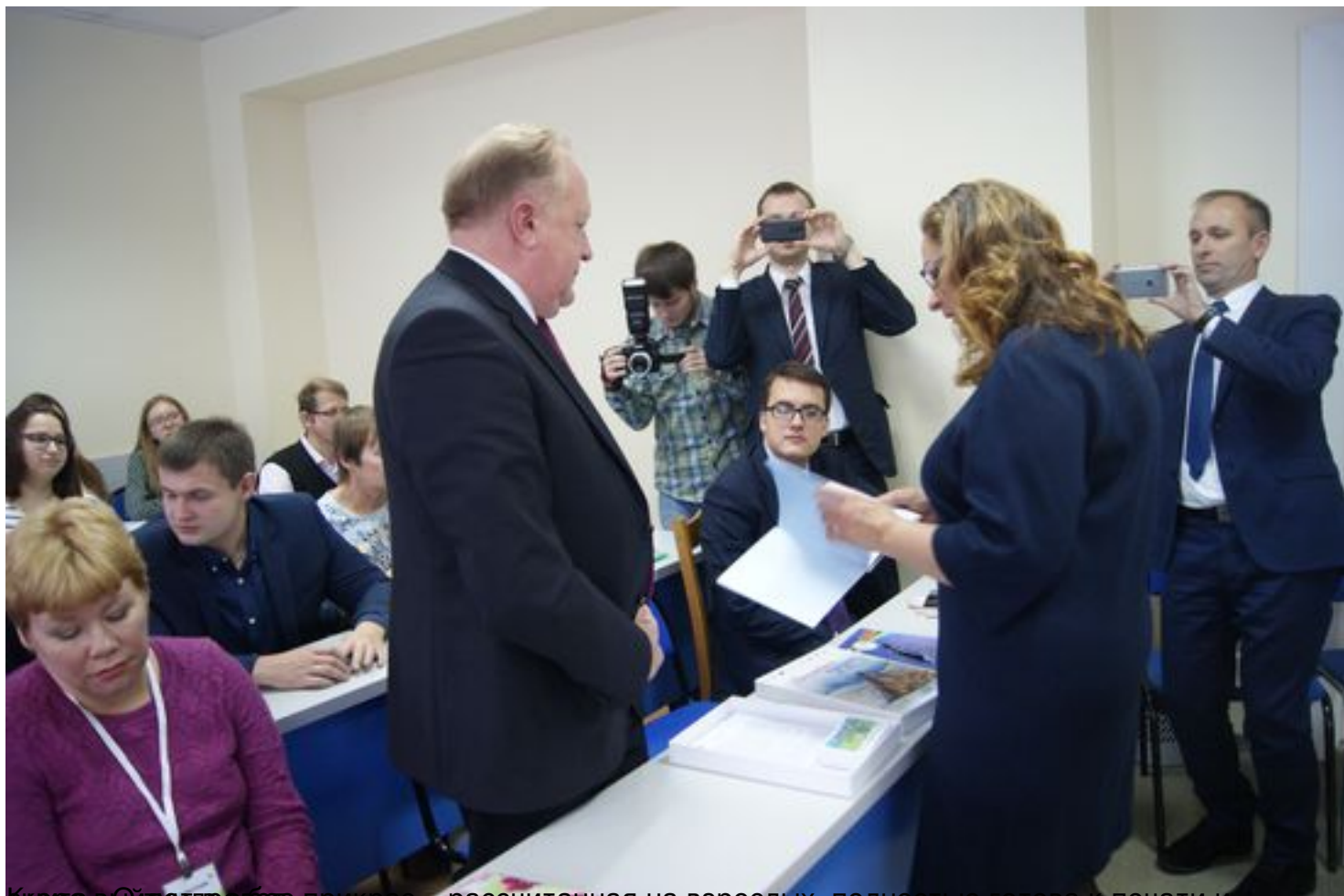
Копия «О тундре без прикрас», рассчитанная на взрослых, полностью готова к печати и